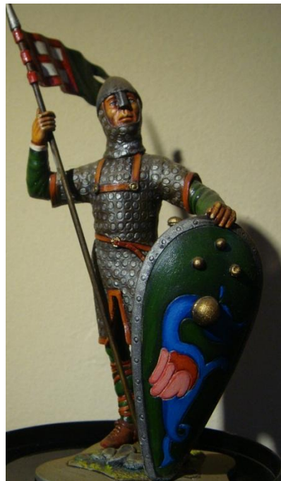
90mm Poste Militaire