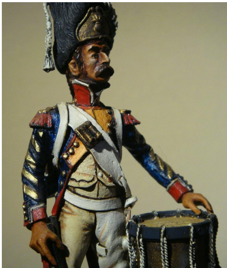
Painted by MiRof Pictures Mirof Brussel Jun 2012