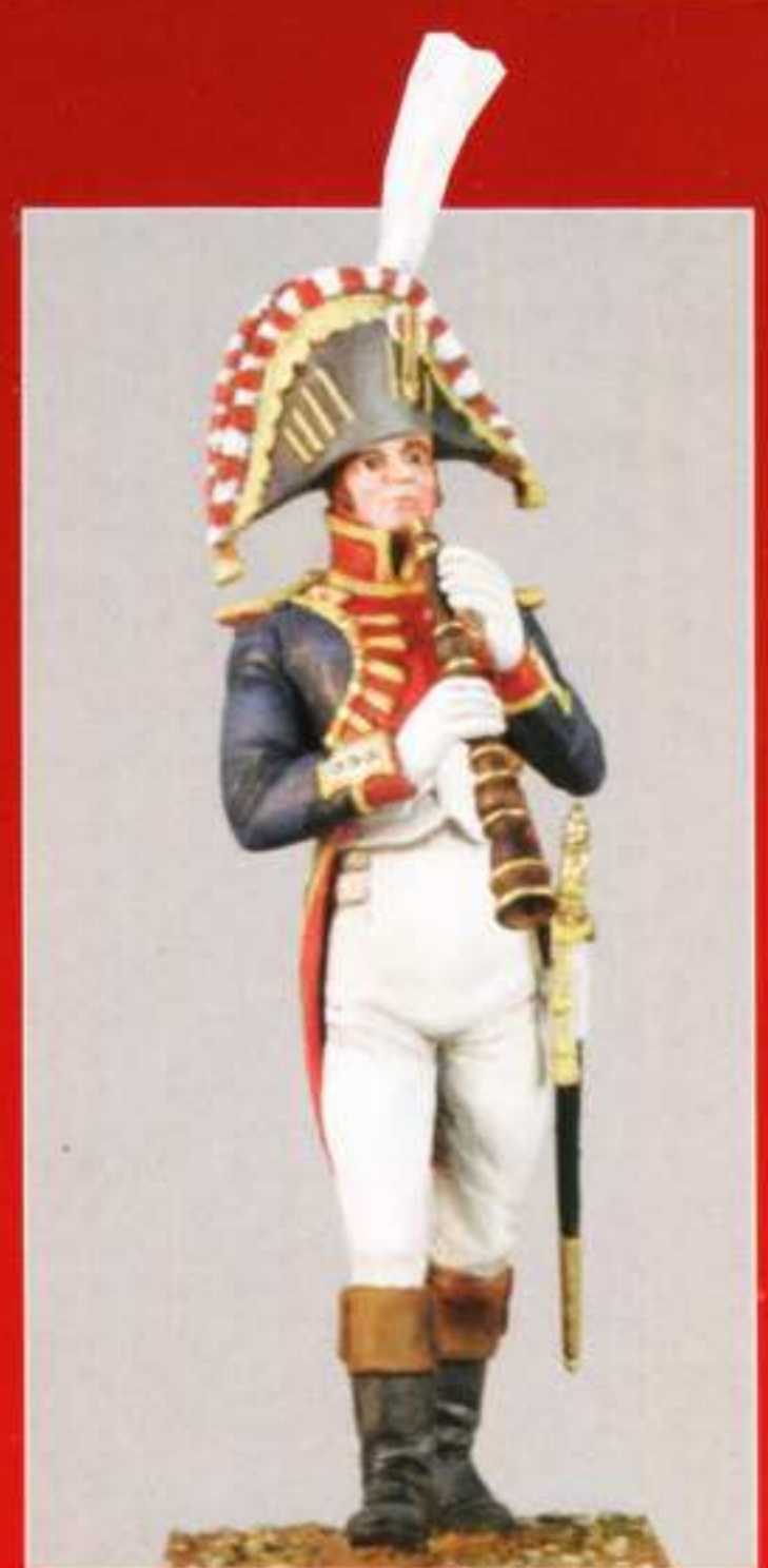
AMU 13 Haubois