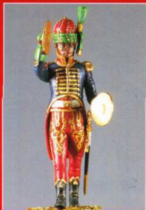
AMU 2 - Cymbalier