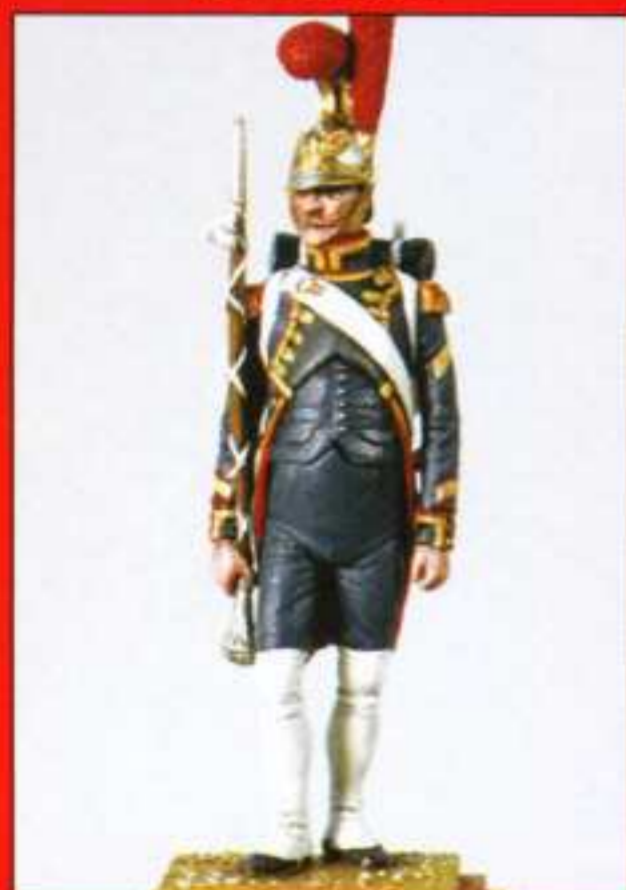
E9 - Tambour Maître