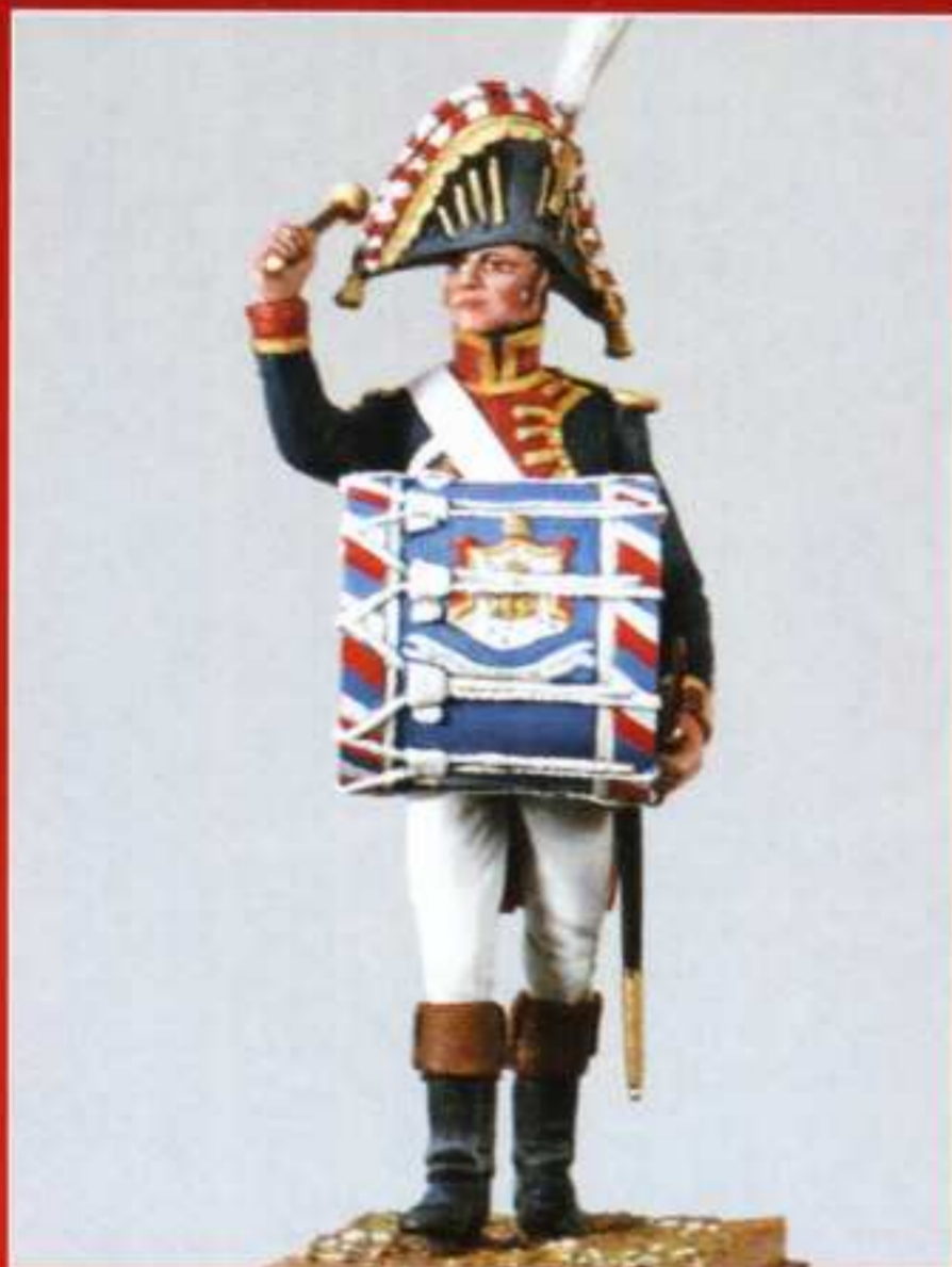
AMU 9 - Grosse caisse