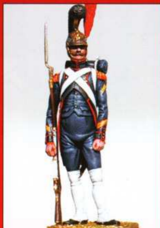
E6 - Sergent