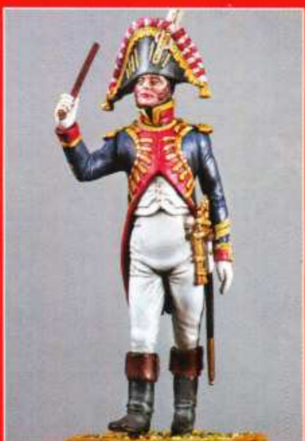
AMU 5 - Chef de musique