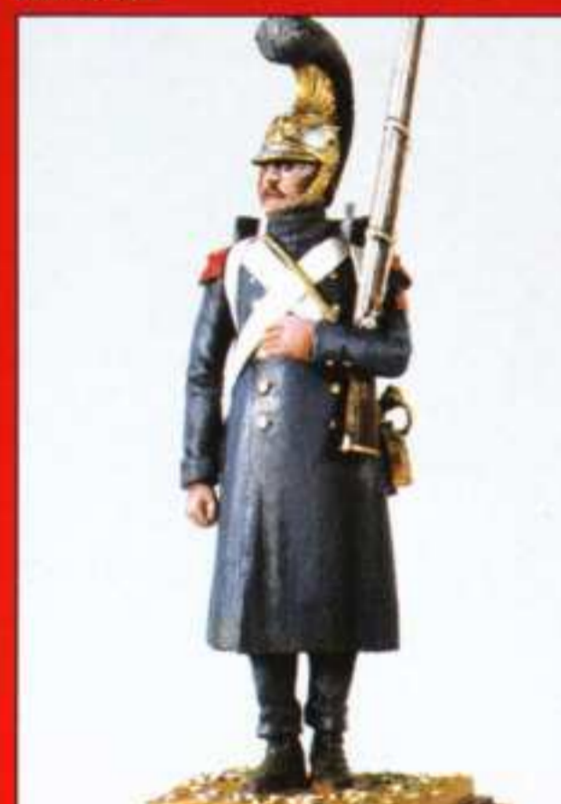
E10 - Soldat en capote