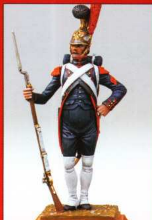
E7 - Soldat