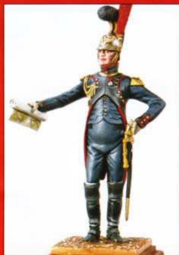
E4 - Officier