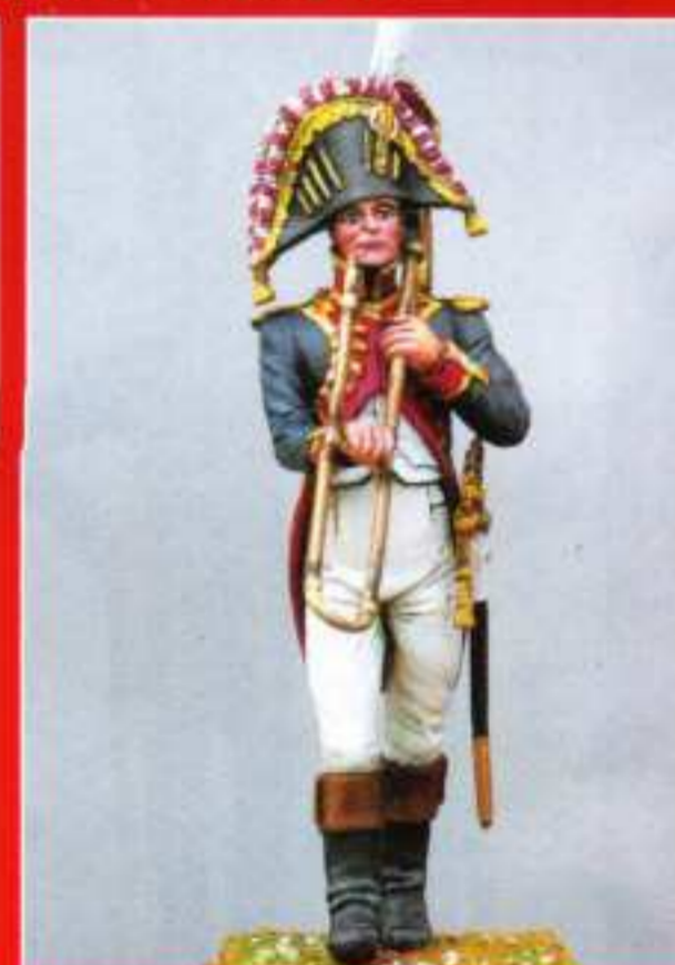
AMU 3 - Trombone