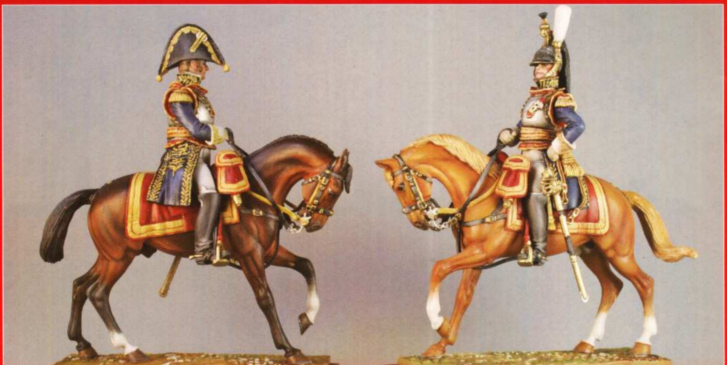
ETA3 : Général de Cuirassier

Figurine à monter et à peindre sculptées par Cyrille Conrad