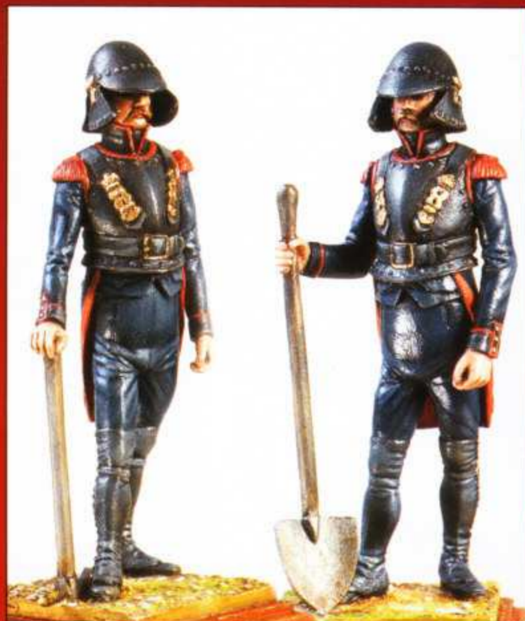
E1 - Tenue de Tranchée