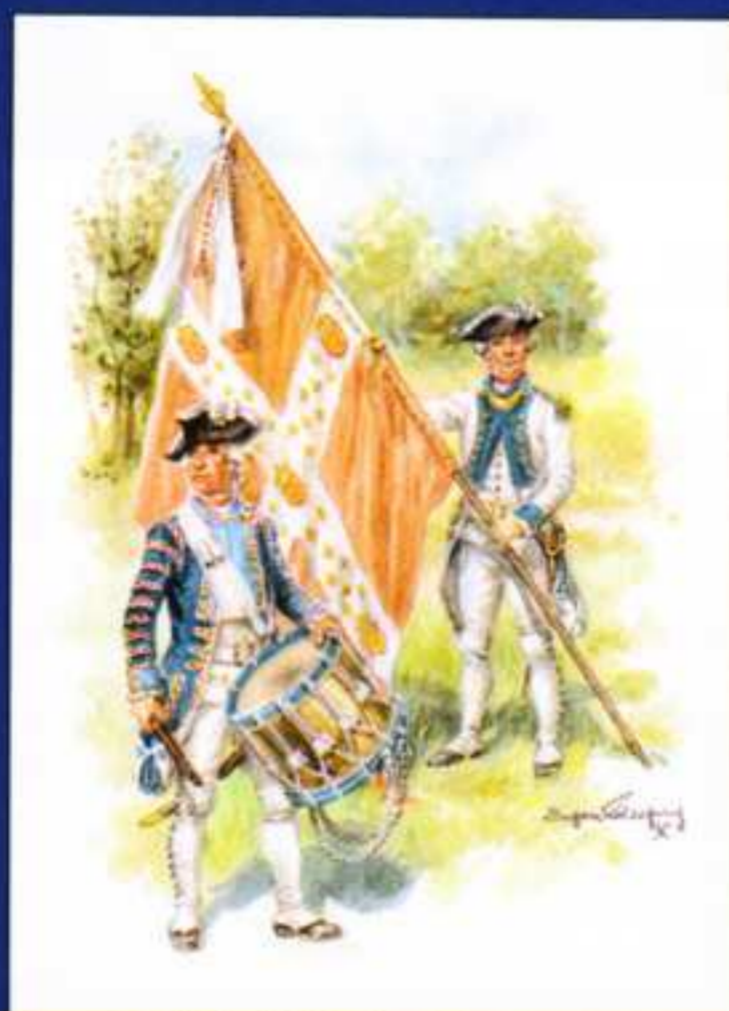
PL1 - Planche Navarre

Le règlement de 1767 avait une base commune à tous les régiments, seules distinctions : les couleurs des revers, parements et la forme des poches. Aussi à partir des bases F2, F3, F4, il vous sera possible de réaliser d'autres régiments. La Sabretache (7, rue Guersant 75017 PARIS) a édité une série de Tambours aux livrées très colorées.