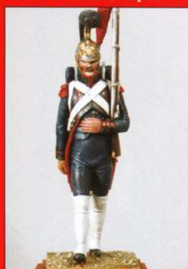
E7B - Soldat défilé

Figurines à monter et à peindre sculptées par Cyrille Conrad (DISPONIBLES ÉGALEMENT EN UK ET GERMANY)