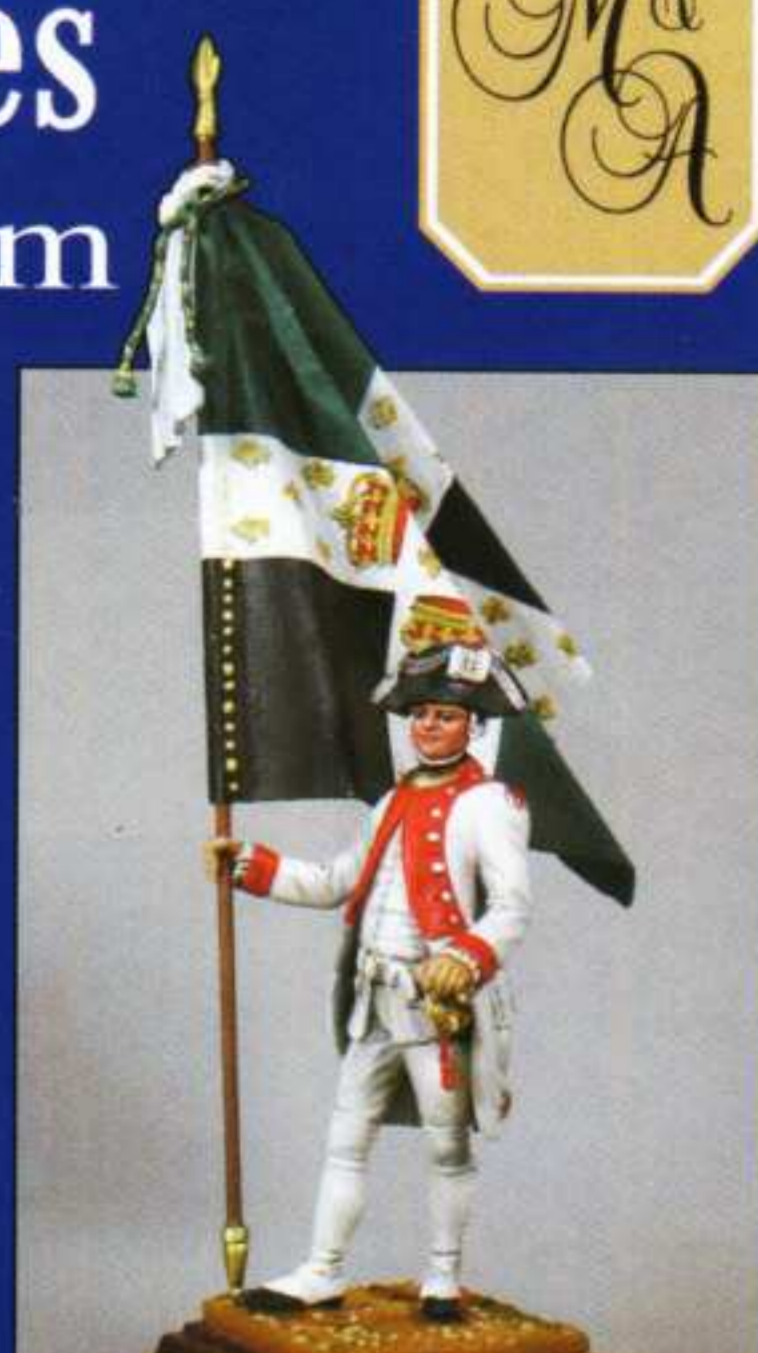
Porte-drapeau de la Reine (*base F3)

Le règlement de 1767 avait une base commune à tous les régiments, seules distinctions : les couleurs des revers, parements et la forme des poches. Aussi à partir des bases F2, F3, F4, il vous sera possible de réaliser d'autres régiments. La Sabretache (7, rue Guersant 75017 PARIS) a édité une série de Tambours aux livrées très colorées.