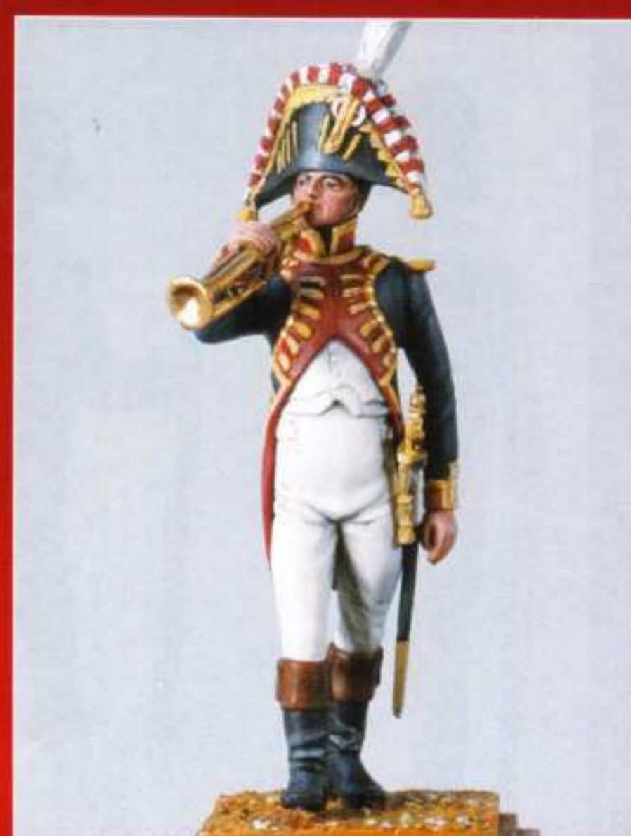
AMU 10 - Trompette