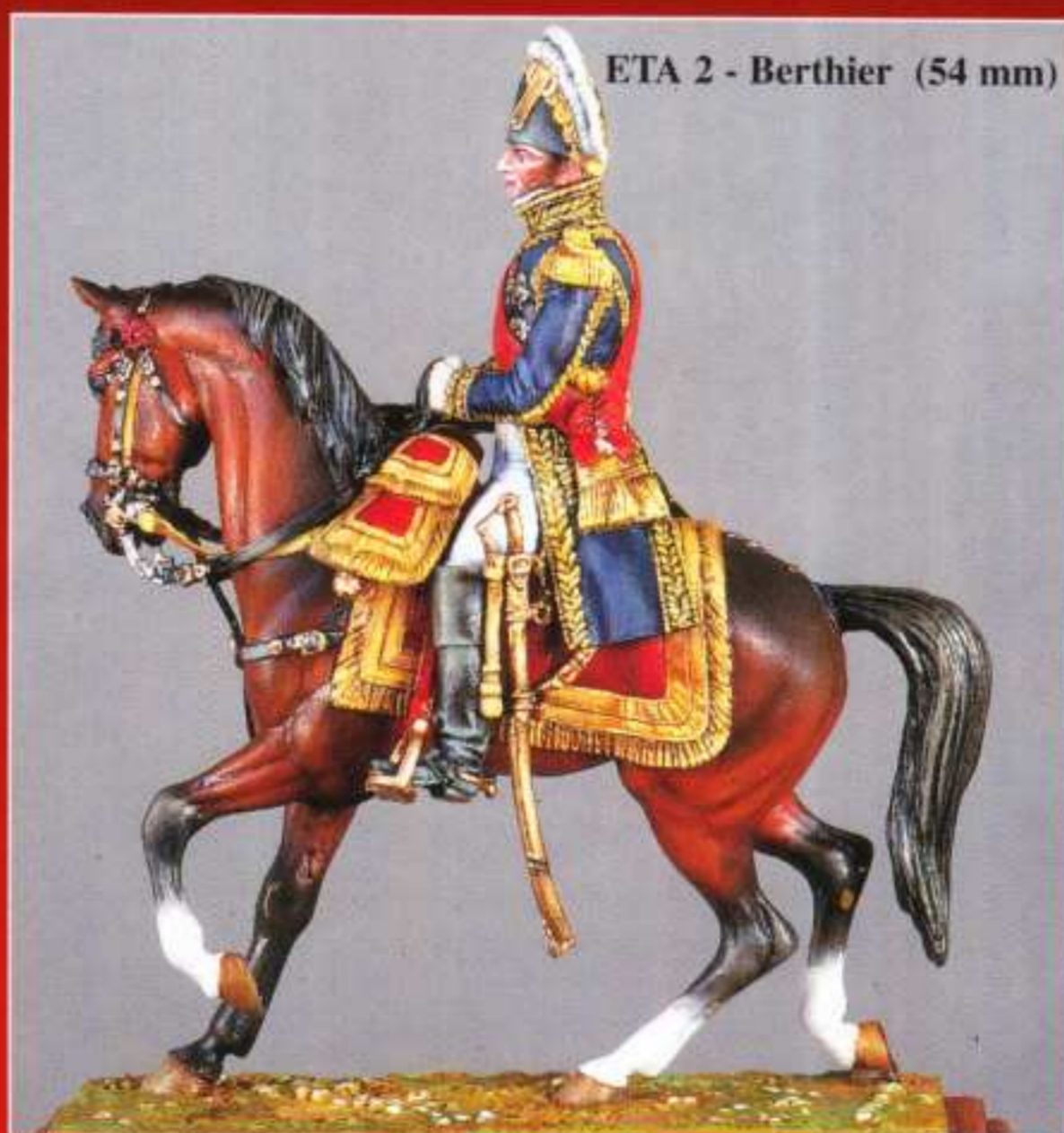
ETA 2 - Berthier (54 mm)