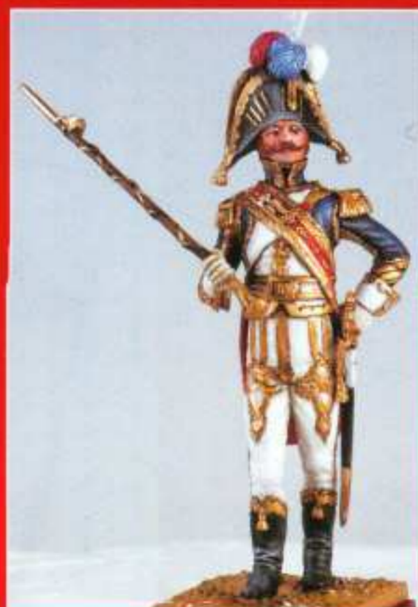
A 8 - Tambour Major