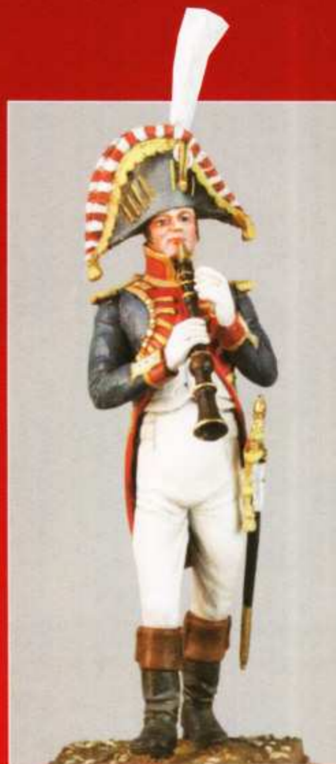
AMU 12 Clarinette