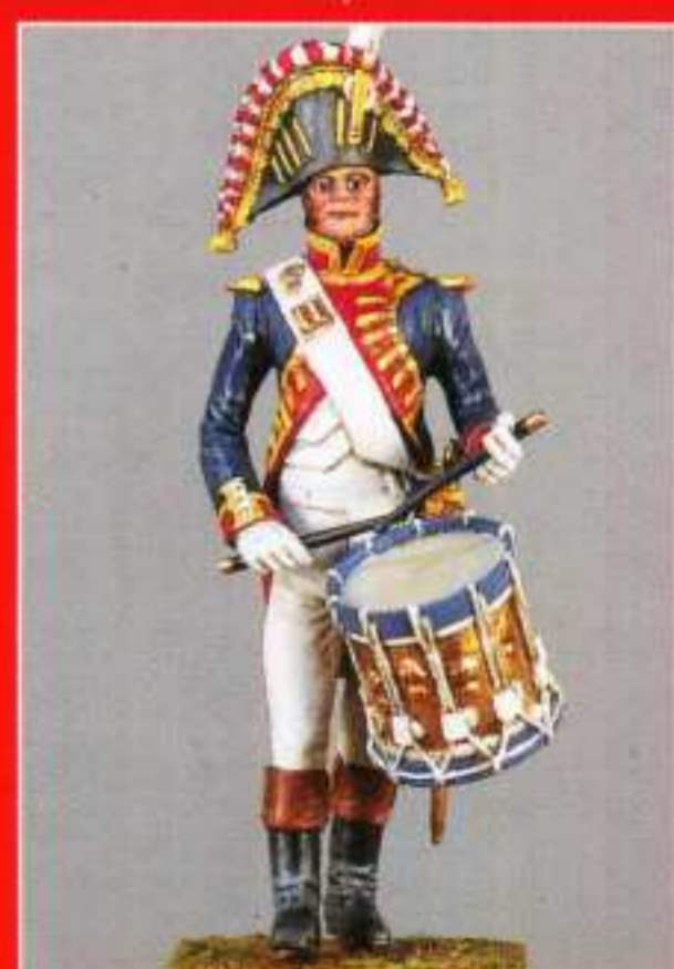
AMU 8 - Caisse roulante

Figurines à monter et à peindre sculptées par Cyrille Conrad (DISPONIBLES ÉGALEMENT EN UK ET GERMANY)