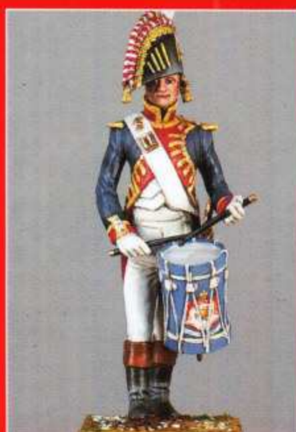
AMU 7 - Caisse claire