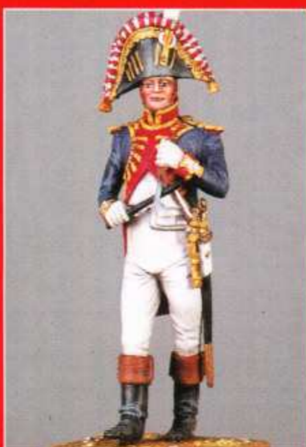
AMU 6 - Triangle