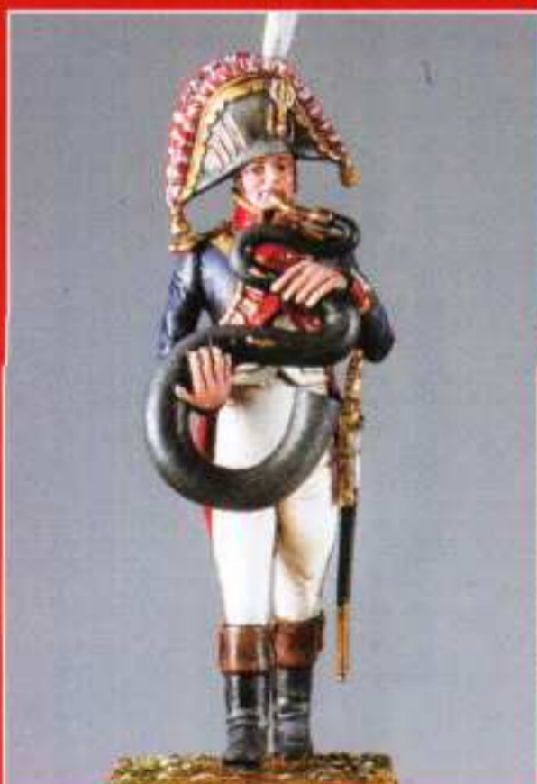
AMU 1 - Serpent