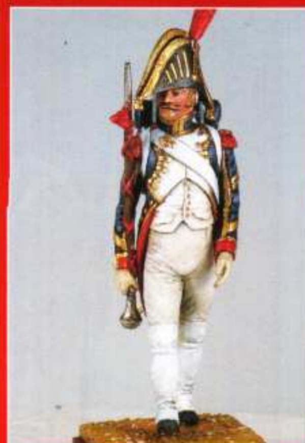
A 9 - Tambour Maître