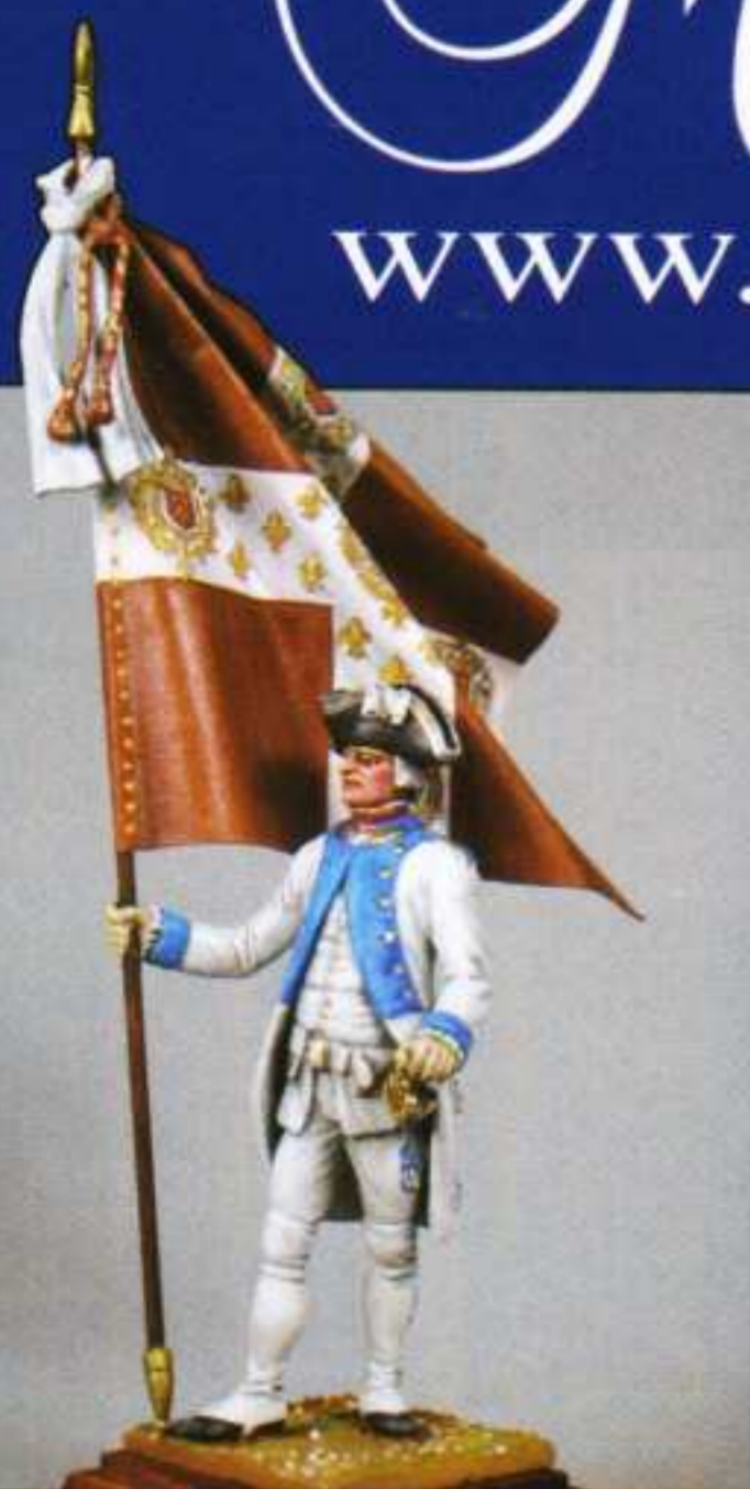
F3 - Porte-drapeau Navarre 1767