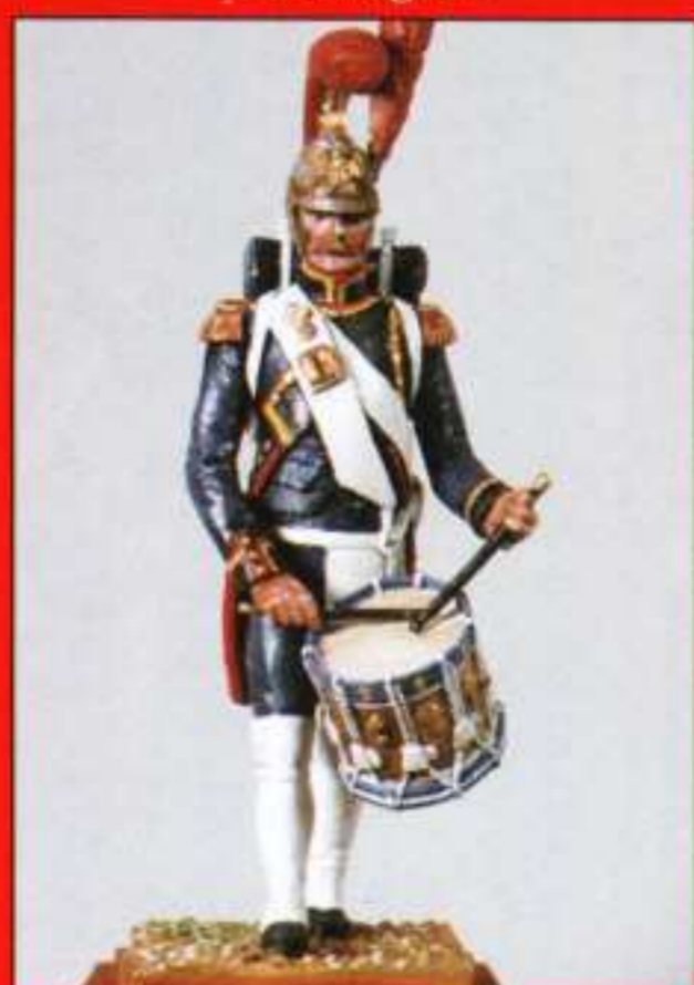
ELB - Tambour défilé