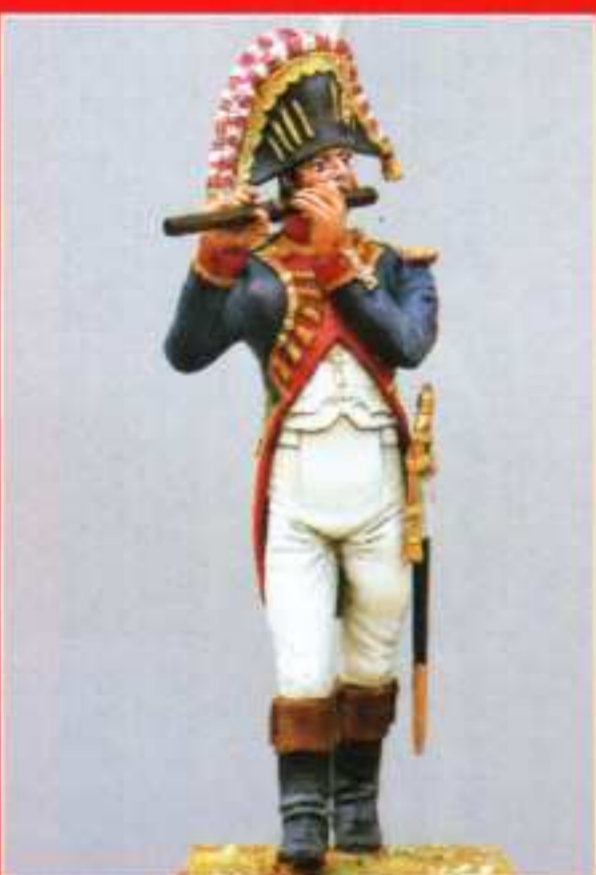
AMU 4 - Flûte