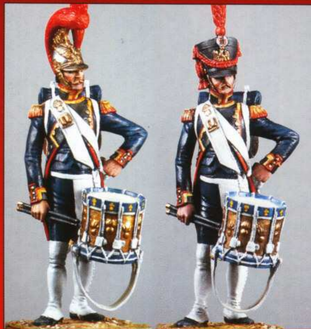
E2 - Tambour

Les références : tambour, soldat et sergent possèdent une tête avec casque et une tête avec shako permettant des variantes de régiment