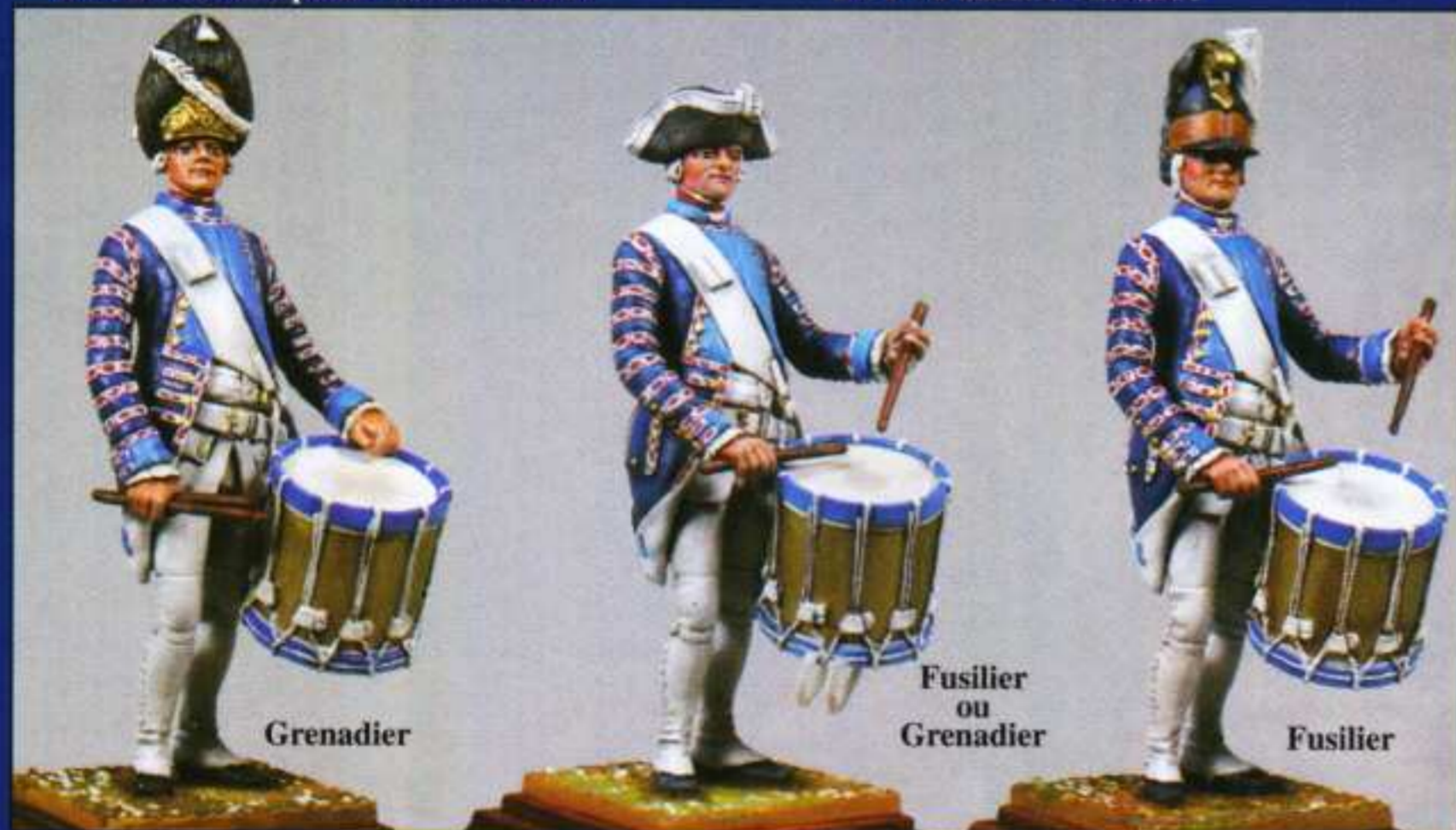
F2 - Tambour de Navarre 1767